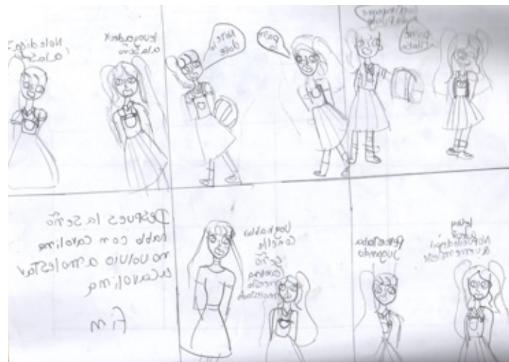
Figura 1: Representación dialógica del conflicto, Subcategoría relación entre el lenguaje y la mente humana.

A continuación, se presentan los resultados del comic creado y representado socialmente con la participación de los niños y niñas del Grado Sexto de la Institución Educativa Distrital “San José”.